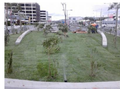
Περιφέρεια Αττικής Συντήρηση πρασίνου ΣΠ12