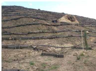
Αναδάσωση αρχαίου χώρου Ολυμπίας