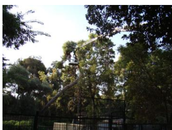
Κλαδέματα Εθνικού Κήπου (Ζαππείου)