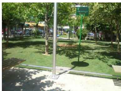
Ανάπλαση Πλατείας Αθανασίου Διάκου