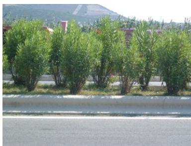
Περιφέρεια Αττικής Συντήρηση πρασίνου ΣΠ10