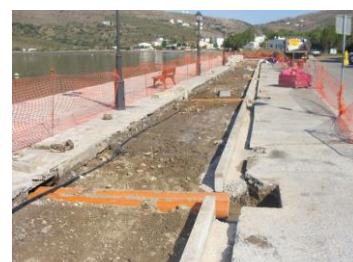
Κατασκευή λιμενικών έργων